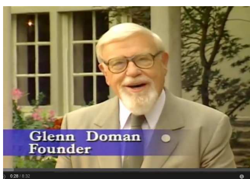
Figura 1: Glenn Doman, fundador do IAHP

(0:27) Se você me pedir para resumir, em um único parágrafo, tudo que nós aprendemos na metade do século passado, este parágrafo seria: “Nós estamos persuadidos, pelo que tem acontecido, que toda criança nascida tem no instante do nascimento uma inteligência potencial maior do que Leonardo da Vinci jamais usou.” Eu mencionei Leonardo porque ele é meu gênio favorito. Eu penso que há