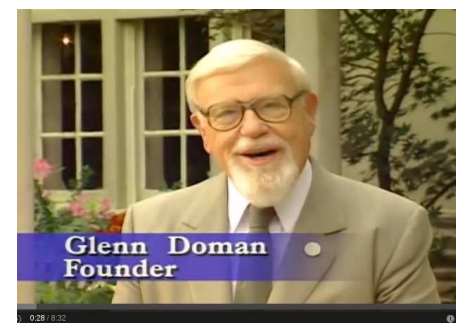
Figura 1: Glenn Doman, fundador do IAHP

(0:27) Se você me pedir para resumir, em um único parágrafo, tudo que nós aprendemos na metade do século passado, este parágrafo seria: “Nós estamos persuadidos, pelo que tem acontecido, que toda criança nascida tem no instante do nascimento uma inteligência potencial maior do que Leonardo da Vinci jamais usou.” Eu mencionei Leonardo porque ele é meu gênio favorito. Eu penso que há pessoas no grande espaço que são gênios. E há outro grande espaço todo de Leonardo em si, contudo nós estamos persuadidos que toda criança