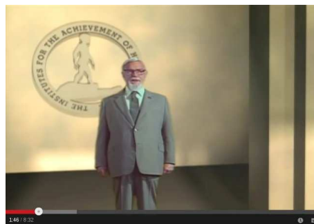
Figura 2: Glenn Doman nos Institutos

(1:08) O processo de educação inicia na idade de seis anos, mas o processo de aprendizagem começa no nascimento. Você pode ensinar um bebê absolutamente qualquer coisa que você possa apresentar para ele de maneira honesta, factual e alegre.