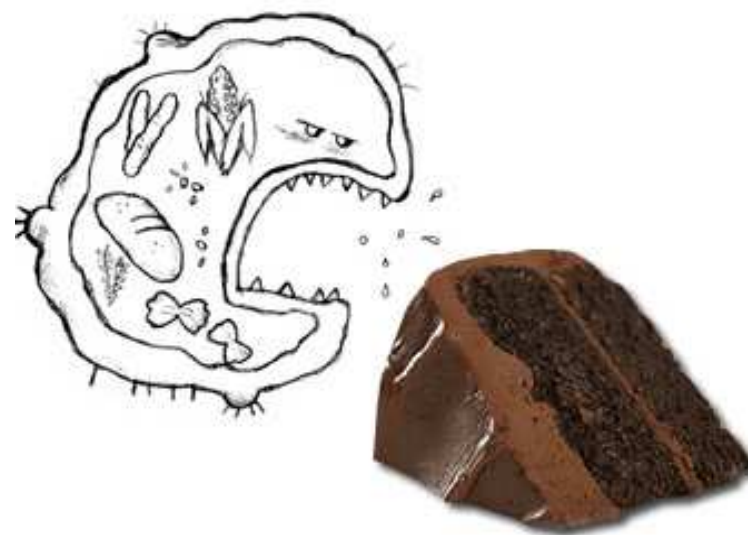
Figura 1.5: Células cancerígenas se alimentam de açúcar

Agora aqui temos um ponto crítico para lembrar: Quanto mais glicose você tomar, mais você vai alimentar as células cancerígenas. Por outro lado, porque as células cancerígenas exigem tanta glicose,