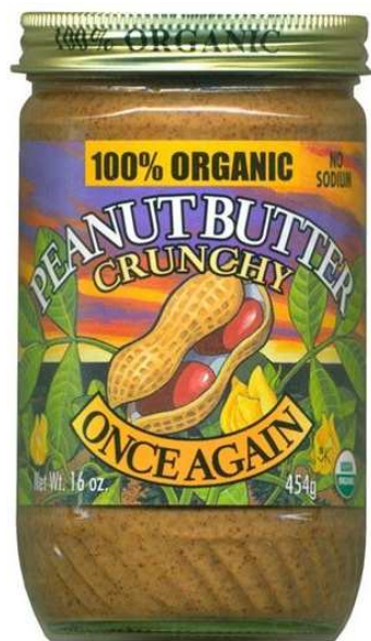
Figura 1.3: Manteiga de Amendoim Orgânica.

porque é assim que são mantidas pra evitar a separação.