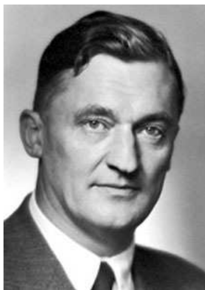
Figura 2.3: Axel Hugo Theodor Theorell