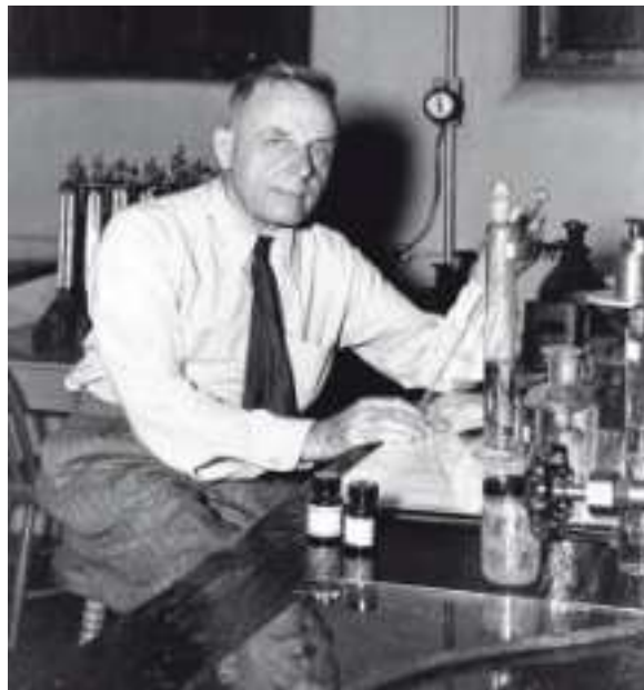
Figura 2.1: Doutor Otto Warburg

Para entender a principal causa do câncer, temos que olhar no passado para um pesquisador muito importante, o Dr. Otto Warburg 1 . O Dr. Warburg foi um médico e cientista da Alemanha ganhador do Prêmio Nobel. Este cientista tem sido considerado como o maior bioquímico do século 20. Ele realizou tanto em sua vida que muitas pessoas até o consideram o bioquímico mais talentoso de todos os tempos. Em 1931, o Dr. Warburg recebeu o Prêmio Nobel em “Fisiologia ou Medicina” pela descoberta da enzima da respiração celular e como ela funcionava [6].