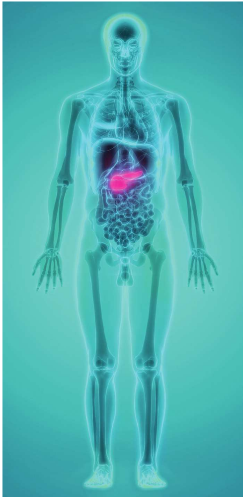
Figura 3: Pâncreas, fígado, estômago, rins e duodeno