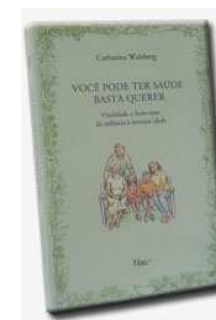
Figura 2: Livro: “Você Pode Ter Saúde - Basta Querer”

Ed. Rocco - autora Catharina Walzberg - 304 páginas - Formato 14x21 cm, brochura. Manual prático de vitalidade e bem estar da infância à terceira idade. Permeado de incríveis experiências de sucesso no tratamento de doenças ditas incuráveis. Um livro de consulta motivador e indispensável para todos aqueles que almejam viver a vida na plenitude de sua potencialidade física e mental.