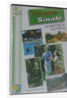
Figura 5: DVD1: “Alimentação Saudável”

Curso em 5 passos sobre a arte de preparar uma alimentação saudável e saborosa , transformando-a em uma fonte de saúde. Duração: 60 minutos