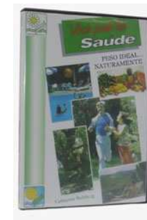
Figura 8: DVD4: “Peso Ideal ... Naturalmente”

Conheça o poder da Naturopatia Européia no combate às mais diversas moléstias crônicas da atualidade. Uma entrevista da repórter Lígia Rupp com Catharina Walzberg. Duração: 60 minutos.