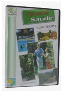
Figura 6: DVD2: “Hidroterapia”