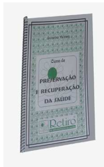
Figura 3: Apostila: “Preservação e Recuperação da Saúde”

Tratamentos naturais caseiros, 33 páginas, formato 21x30 cm., capa de plástico transparente e espiral