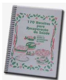
Figura 4: Livro: “170 Receitas para Recuperação da Saúde”

Culinária ovo-lacto-vegetariana natural, 66 páginas, formato 14x21 cm., capa de plástico transparente e espiral.